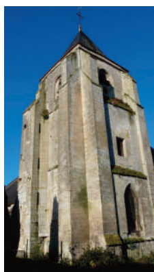
La tour Clocher

Concert de l'Ecole de Musique Intercommunale 20h00. Eglise de Vivières.